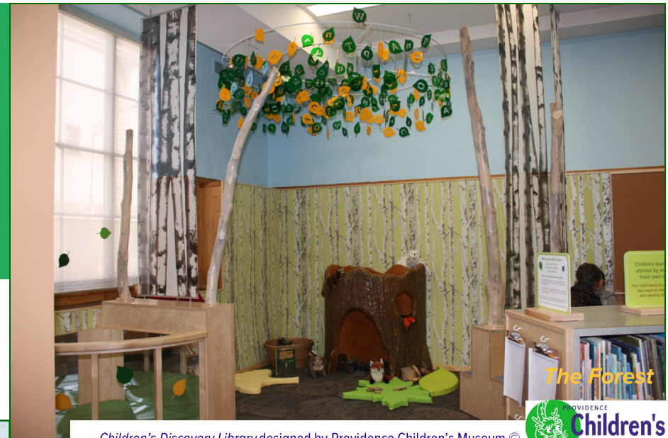
Children's Discovery Library designed by Providence Children's Museum ©

Estamos encantados de haber trabajado con El Museo de los Niños de Providence a crear el Chace Los niños descubren la Biblioteca en la PPL, con los fondos de la familia Chace, La Fundación de la Biblioteca Publica de Providence y generosos donadores.